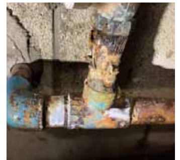
温水器近くの老朽化した水道管(鉄管)

その手間と費用の負担を嫌がって楽な施工をしてしまうと後で水量不足という面倒なトラブルを引き起こすのです。