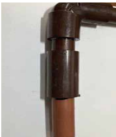
古い配管を残して接続された塩化ビニール管

衝撃が原因で起こる漏水は水量が多いため被害もまたたく間に広がっていきます。速やかに水道の元栓を止めることができれば、被害も最小限になりますが、水道やトイレが使えなくなるなどの不自由は避けられません。