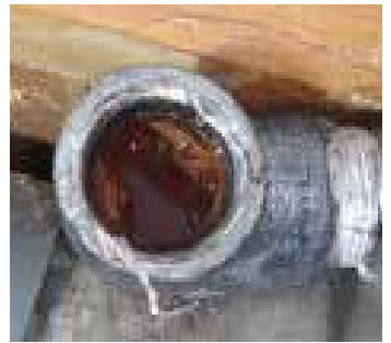
老朽化して腐食が進行した鉄管

これは古い鉄管の内部をよく確認しないで繋ぐと起こりうる事象です。古い鉄管は老朽化による腐食が進むとサビが配管内部に固着して水流を妨げます。人体で起こる動脈硬化のイメージです。