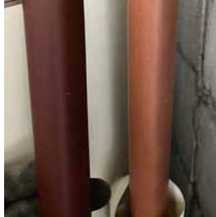
塩化ビニール管の老朽化による変色

温水器本体の寿命は平均して20年程度ですが、せっかく新品に取替えても 古い配管が残っていた場合、5年～10年位で漏水トラブルになる危険性が高まる のです。